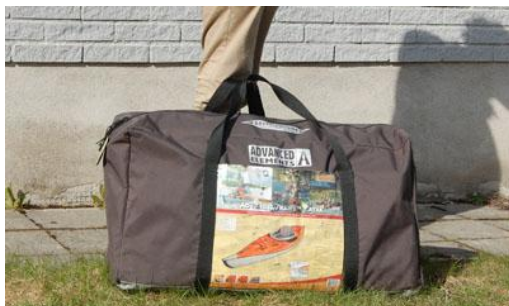
1. Kajaken i väska